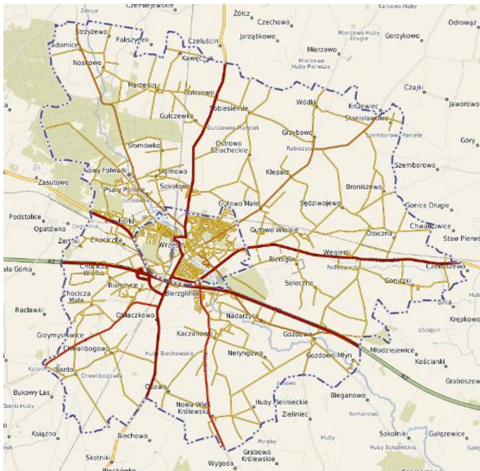
Mapa: Miasto i Gmina Września

Sieć osadniczą gminy tworzy miasto Września, które położone jest w środkowej części gminy oraz 33 wsie sołeckie. Powierzchnia miasta i gminy wynosi 221,84 km 2 , z tego na miasto przypadają 12,73 km 2 , a na obszar wiejski – 209,11 km 2 . Głównym ciekim wodnym jest rzeka Wrześnica, prawy dopływ Warty, przepływająca z północnego-zachodu na południowy-wschód.