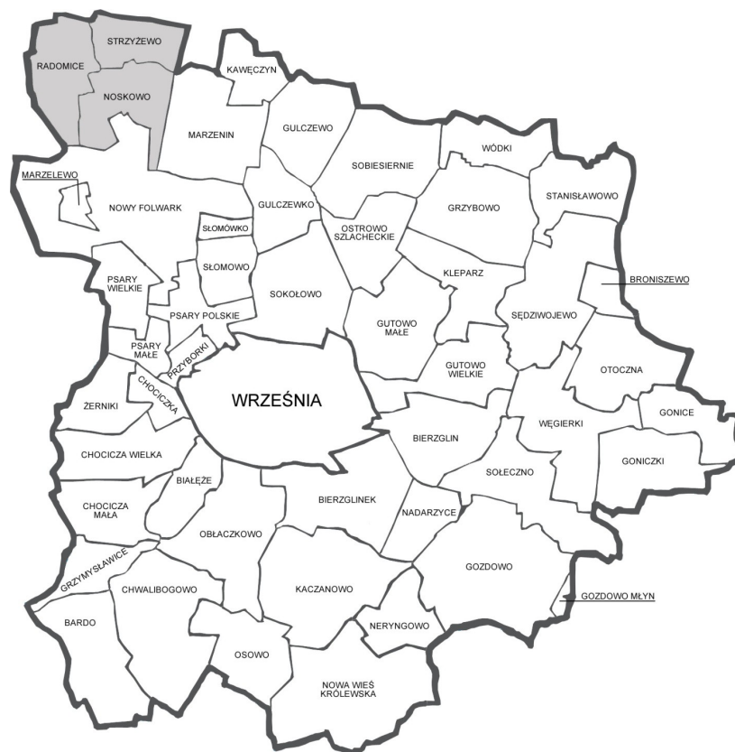
Ryc. 1 Położenie Strzyżewa, Noskowa i Radomic na tle sąsiadujących sołectw

droga klasy L. Nie występują na niej obiekty typu most, estakada lub wiadukt. Jest to droga projektowana do powstania.