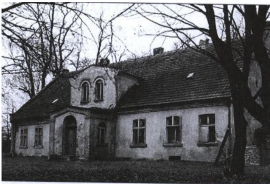
Ryc. 2 Radomice - nieistniejący już dwór z XIX w.

zabytków pod sygnaturą 2643/A. Obecnie budynek ten nie istnieje - został rozebrany pod warunkiem odbudowy w dawnej formie. Do odbudowy nie doszło.